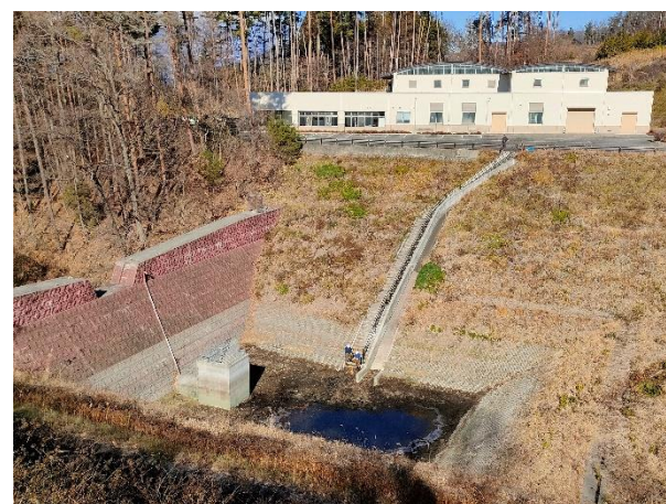
【防災調整池の全景】