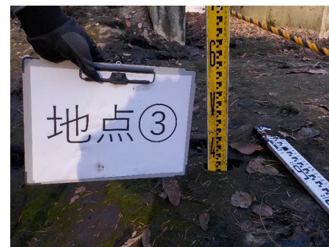
【地点③で計測をしている状況】