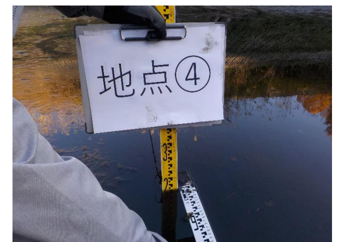
【地点④で計測をしている状況】