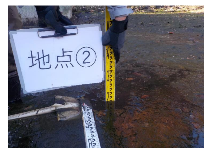
【地点②で計測をしている状況】