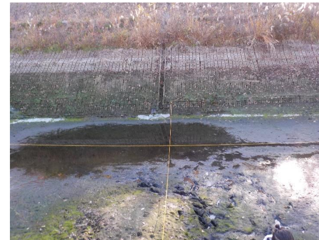
【各測定地点の確認】