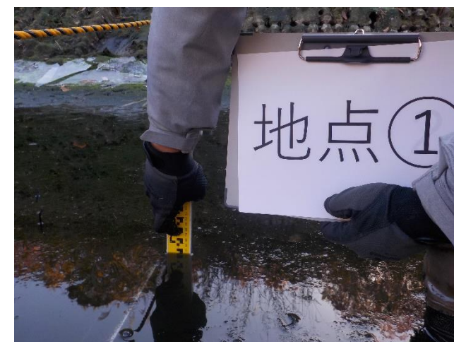
【地点①で計測をしている状況】