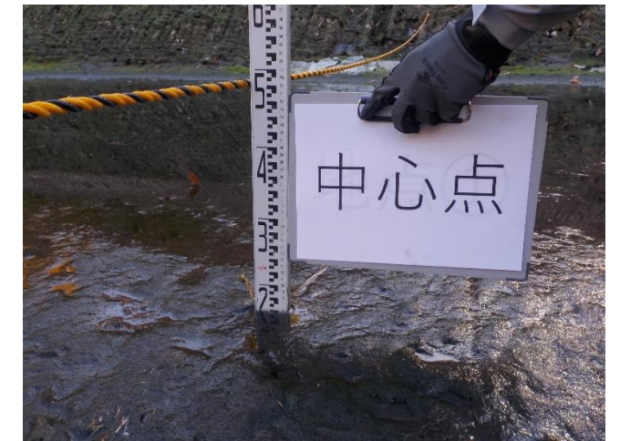
【中心点で計測をしている状況】